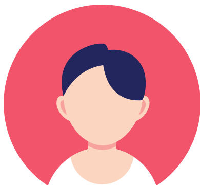
AK i starten af historien

AK udvikler sig gennem historien med sine holdninger og sit syn på sin far. Skriv 3 tillægsord, der beskriver, hvordan AK er i begyndelsen, og 3 tillægsord, der passer på hende i slutningen af historien.